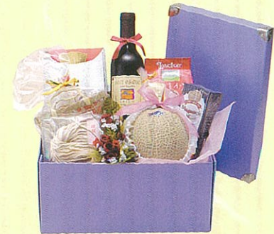
ルビー 本体価格 7,000円

クール便OK アンデスメロン、クラムチャウダー、コーンクリーム、 カクテル、ウエハース、フルーツカクテル缶、ハヤシラ イスの素、あらびきステーキ