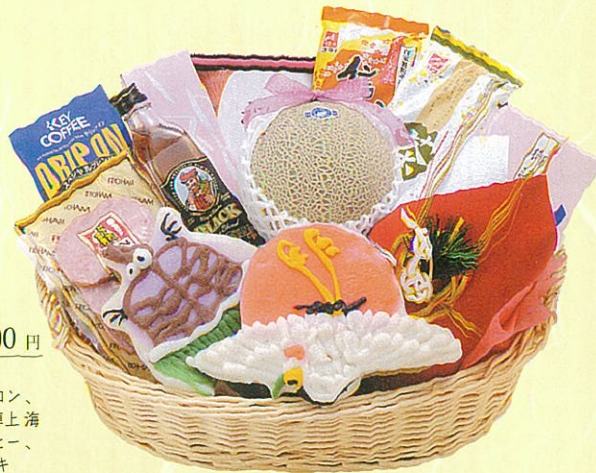
寿10 本体価格 10,000円

クール使不可 蒲鉾・鯛、蒲鉾・亀、アンデスメロン、 寿昆布、信州そば、茶そば、つゆ、卓上海 苔、鯉節セット、レギュラーコーヒー、 水割リウイスキー、あらびきステーキ