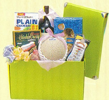
オリーブ06 本体価格 6,000円

クール便OK アンデスメロン、赤ワイン、フィットチーネパスタ、カレー、ナッツ缶、紅茶、ブレンクラッカー、ランチョンマット