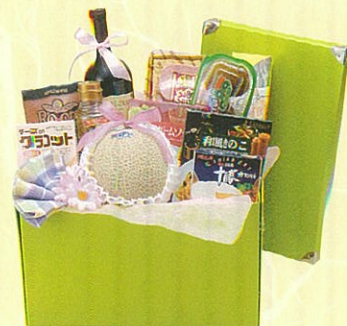
オリーブ08 本体価格 8,000円

クール便OK アンデスメロン、赤ワイン、フィットチーネパスタ、カレー、ナッツ缶、紅茶、ブレンクラッカー、ランチョンマット