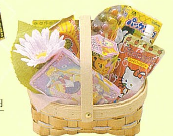
女子向け 本体価格 2,000円