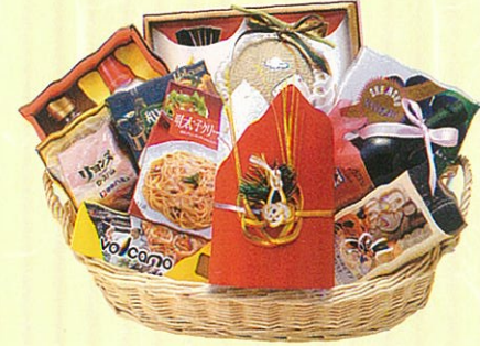
結(むすび)15 本体価格 15,000円

クール使不可 寿昆布、メロン、赤ワイン、パスタ、パスタソー ス、ゼリーセット、サラダ油セット、砂糖、鯉バック、 りんご、レギュラーコーヒー、ロースハム