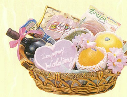
プーケ 本体価格 5,000円

クール便OK 蒲鉾・ハート型、赤ワイン、あらびきステーキ、生ハム、サラミ、グレープフルーツ、オレンジ、アボガド