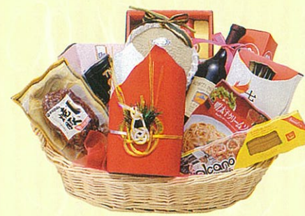
結(むすび)10 本体価格 10,000円

クール使OK 寿昆布、アンデスメロン、カクテル、鯉バック、ク ラッカー、卓上海苔、サラダ油、レギュラーコー ヒー、砂糖