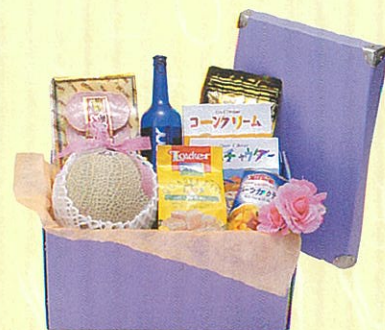
エメラルド 本体価格 6,000円

クール便OK インスタントコーヒー、クラッカー、パスタ×2ヶ、パ スタソース、調味用ペースト、オリーブオイル、オー レンジ、キウイ