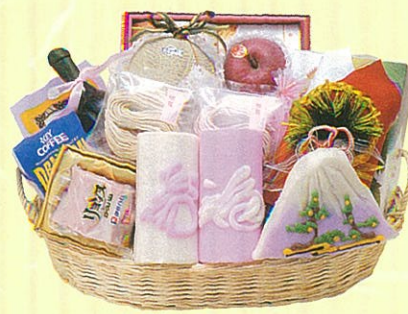
寿20 本体価格 20,000円

クール使不可 蒲鉾・紅白トボ、蒲鉾・富士、メロン、白ワイン、 羅臼昆布、健康茶、レギュラーコーヒー、サラダ油 セット、グラタンセット、鯉節セット、グレープフ ルーツ、砂糖、ロースハム