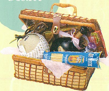
ガラジオラス 本体価格 15,000円

クール便OK メロン、蒲鉾・鯛、蒲鉾・亀、ワイン、パスタ、パスタソース、レギュラーコーヒー、ゼリーセット、フルーツソース、ロスハム