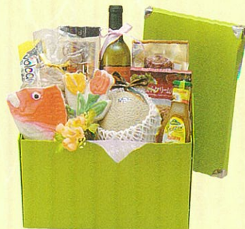
オリーブ12 本体価格 12,000円

クール便OK アンデスメロン、赤ワイン、パスタ、パスタソース×2ケ、レギュラーコーヒー、オリーブオイル、カマンベールチーズ、ランチョンマット、キウイ×3ケ、クラコット、あらびきステーキ