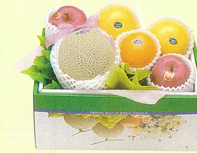
りんどう 本体価格 4,000円