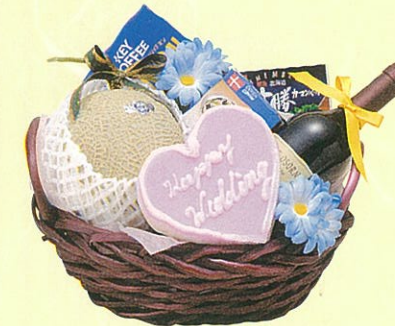
ポピー 本体価格 6,500円

クール便OK 蒲鉾・ハート型、赤ワイン、あらびきステーキ、生ハム、サラミ、グレープフルーツ、オレンジ、アボガド