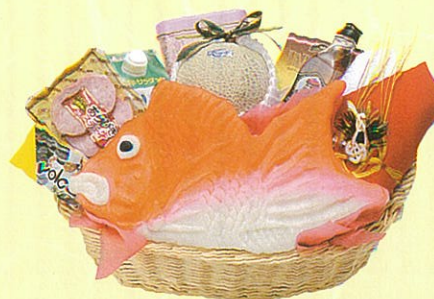
幸12 本体価格 12,000円

クール使不可 蒲鉾、アンデスメロン、寿昆布、カクテル、サラダ油、缶 入鯉節、グレープフルーツ、オレンジ、あらびきステーキ