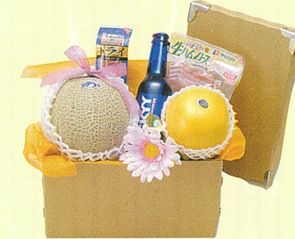
セイジ 本体価格 4,000円

クール便OK メロン、ぶどう、グレープフルーツ、りんご、キウイ、ハワイヤ、オレンジ