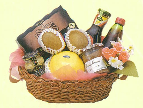
プロヴァンス 本体価格 3,500円

クール便OK アンデスメロン、クラッカー、パスタ、パスタソース、 瓶入パスタソース、調味用ペースト、オリーブオイル、 グレープフルーツ