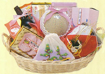
寿08 本体価格 8,000円

クール使不可 蒲鉾・鯛、蒲鉾・亀、アンデスメロン、 寿昆布、信州そば、茶そば、つゆ、卓上海 苔、鯉節セット、レギュラーコーヒー、 水割リウイスキー、あらびきステーキ