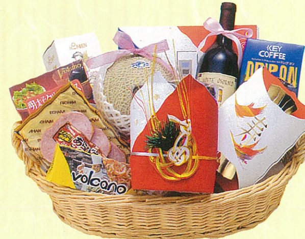
結(むすび)08 本体価格 8,000円

クール使不可 羅臼昆布、メロン、赤ワイン、米見うどん×2ヶ、 パスタ、パスタソース、サラダ油セット、レギュ ラーコーヒー、ワイン用ケース、鯉節セット、ぶど う、ロースハム