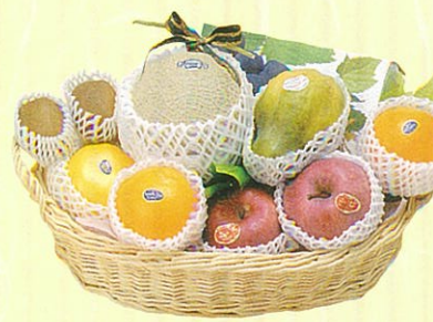
スマイレ 本体価格 8,000円

クール便OK メロン、日本酒、たまごそうめん×2ケ、紫蘇そうめん×2ケ、有機醤油、焼豚、オレンジ、ランチョンマット、缶入鯉節