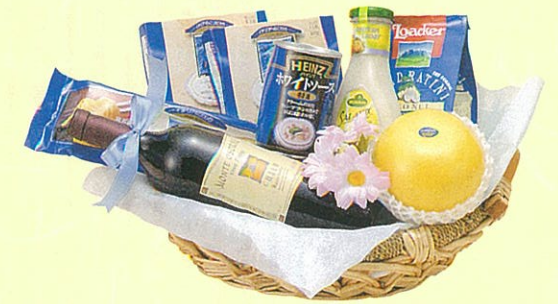
マルセイユ 本体価格 5,000円

クール便OK クラコット、カクテル、スープ、エッグパスタ、ジャム、 ハーブティ、オレンジ、キウイ