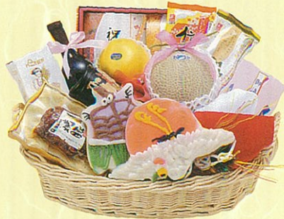
寿12 本体価格 12,000円

クール使不可 蒲鉾・富士、アンデスメロン、赤ワイン、信州そ ば、茶そば、卓上海苔、ボン酢、缶入鯉節、寿昆 布、あらびきステーキ