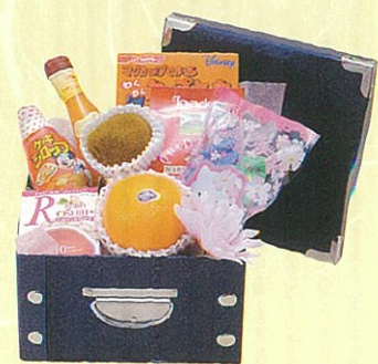
サファイヤ 本体価格 3,500円

クール便OK レギュラーコーヒー、カクテル、ドレッシング、エッグ パスタ、あらびきステーキ、オレンジ、アボガド