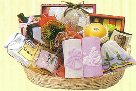
寿18 本体価格 18,000円

クール使不可 蒲鉾・鯛、蒲鉾・亀、メロン、寿昆布、赤ワイン、 パスタ、パスタソース、サラダ油セット、グラタン セット、鯉節セット、レギュラーコーヒー、砂糖、 焼豚、りんご