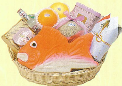
幸10 本体価格 10,000円

クール使不可 蒲鉾・紅白トボ、蒲鉾・富士、メロン、白ワイン、 米見うどん×2ヶ、クッキー缶、レギュラーコー ヒー、ぶどう、りんご、鯉節セット、羅臼昆布、 砂糖、ロースハム