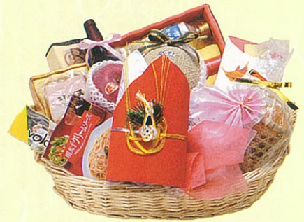
結(むすび)12 本体価格 12,000円

クール使不可 寿昆布、メロン、赤ワイン、パスタ、パスタソー ス、卓上海苔、サラダ油セット、レギュラーコー ヒー、鯉バック、ボン酢、焼豚