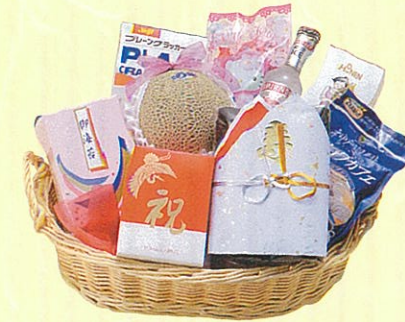
結(むすび)06 本体価格 6,000円

クール使OK 寿昆布、アンデスメロン、カクテル、鯉バック、ク ラッカー、卓上海苔、サラダ油、レギュラーコー ヒー、砂糖