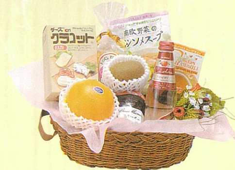
チャオ 本体価格 3,500円

クール便OK クラコット、カクテル、スープ、エッグパスタ、ジャム、 ハーブティ、オレンジ、キウイ