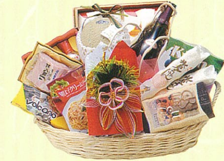
結(むすび)18 本体価格 18,000円

クール使不可 寿昆布、メロン、白ワイン、パスタ、パスタソー ス×2ヶ、レギュラーコーヒー、サラダ油セット、 鯉節セット、ぶどう、ロースハム