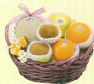
ローズマリー 本体価格 3,500円

クール便OK メロン、蒲鉾・鯛、蒲鉾・チューリップ×2ケ、白ワイン、パスタ、パスタソース、ゼリーセット、レギュラーコーヒー、ドレッシング、焼豚