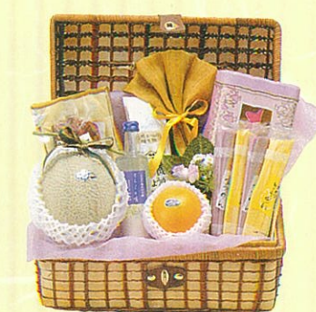
響(ひびき) 本体価格 10,000円

クール便OK アンデスメロン、赤ワイン、パスタ、パスタソース、レギュラーコーヒー、ドレッシング、クラコット、あらびきステーキ