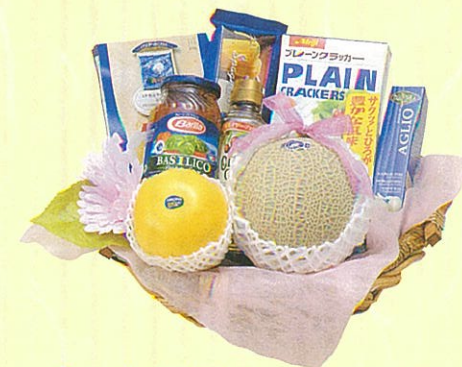
サンタルチア 本体価格 6,000円

クール便OK ホワイトソース缶、ドレッシング、パスタ、パスタ ソース×2ヶ、赤ワイン、ウエハース、グレープフ ルーツ