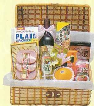
ひまわり 本体価格 6,500円

クール便OK メロン、蒲鉾・ハート型、キャビア、カマンベールチーズ、レギュラーコーヒー、赤ワイン