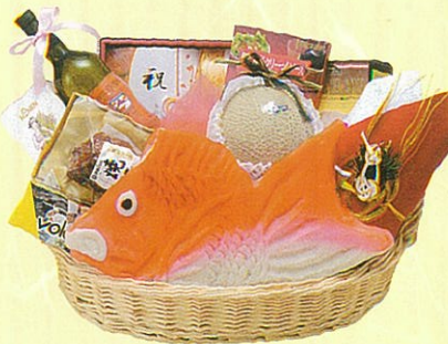
幸15 本体価格 15,000円

クール使不可 蒲鉾・鯛、メロン、寿昆布、水割リウイスキー、 サラダ油、缶入鯉節、レギュラーコーヒー、パスタ、 あらびきステーキ