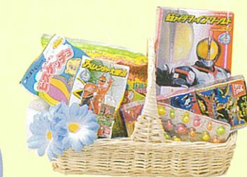
男子向け 本体価格 2,000円