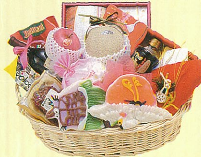
寿15 本体価格 15,000円

クール使不可 蒲鉾・鯛、蒲鉾・亀、メロン、寿昆布、信州そば、 茶そば、卓上海苔、鯉節セット、レギュラーコー ヒー、サラダ油、グレープフルーツ、赤ワイン、 焼豚