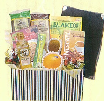
アクアマリン 本体価格 5,000円

クール便OK ケーキミックス、ケーキシロップ、砂糖、ウエハース、 カクテル、オレンジ、キウイ、ハーブティ