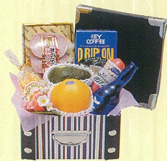
トパーズ 本体価格 3,500円

クール便OK レギュラーコーヒー、カクテル、ドレッシング、エッグ パスタ、あらびきステーキ、オレンジ、アボガド