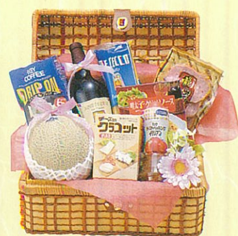
ローズ 本体価格 8,000円

クール便OK 赤ワイン、ブレンクラッカー、パスタ、ミートソース缶、タバスコ、オリーブオイル、レギュラーコーヒー、オレンジ、あらびきステーキ